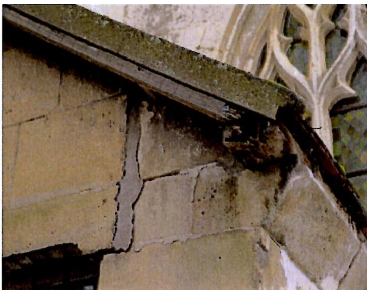
Détail de la baie nord du chœur