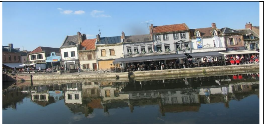
Amiens, quartier saint Leu : les bords de Somme