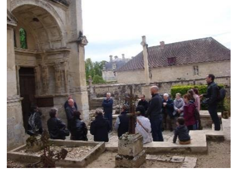
... et de l'église

Nous recevons également de nombreux visiteurs, château + église, tout au long de l'année, participons aux Journées du Patrimoine, journée nettoyage etc... Nous vous invitons à découvrir ces richesses qui font de notre église un trésor d'art et d'histoire à votre porte !