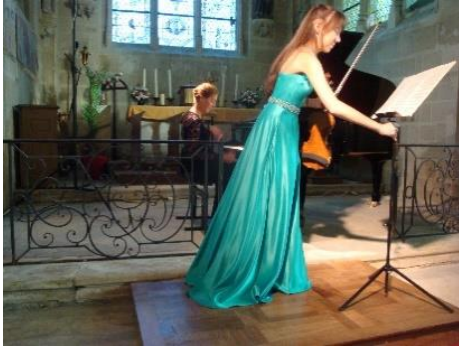
Le Festival du Vexin 2019