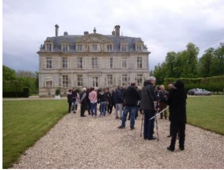
Visites commentées pour les habitants de Guiry, du château