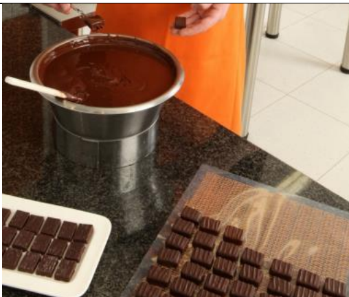
Chocolaterie saint Nicolas