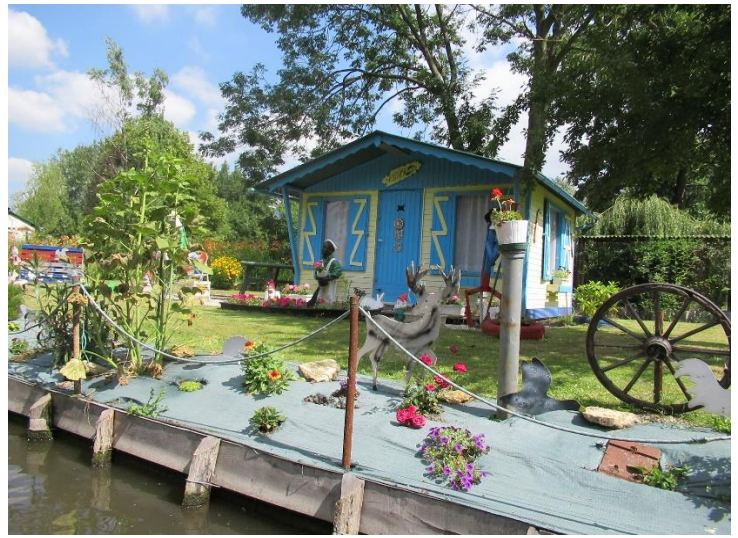
Les Hortillonnages (jardins sur l'eau)

Nous étions une cinquantaine à visiter Amiens. D'abord en barque, dans les hortillonnages, jardins sur l'eau (la Somme), à la limite du centre-ville, entre lesquels, paisiblement nos embarcations déambulent sous un beau soleil de début d'été. Notre déjeuner qui suivit fut très agréable, toujours au bord de l'eau, dans le quartier historique de Saint Leu.